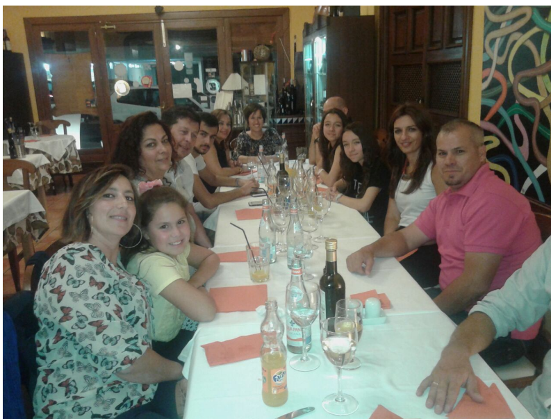
Imagen de los socios de ASOCEPA en Lanzarote que asistieron a la cena y disfrutaron de una comida buenísima en una muy agradable compañía.