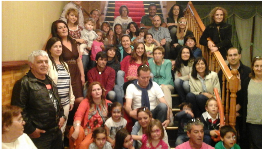
Foto de grupo, para recordar este encuentro.