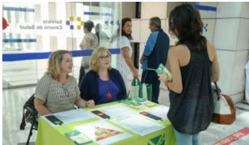
Imagen de la mesa con dos de nuestras voluntarias, publicada en el periódico La Provincia.

Mesa informativa, divulgativa y reivindicativa de la Enfermedad Celiaca, por el Día Nacional del Celiaco 2015 en el Hospital Universitario Insular de Gran Canaria. Durante la mañana, de 10:00 a 13:00 h, con la ayuda de dos voluntarias y socias de Asocepa, y de tarde en horario de 16:00 a 19:00 h, con 4 voluntarias y socias de Asocepa. Esta actividad contó con la presencia de medios de comunicación, (prensa y televisión).